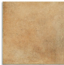
Aldaba Barro G.136