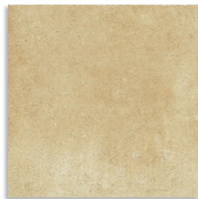
Aldaba Beige G.136