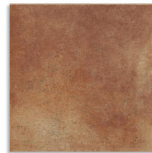
Aldaba Cuero G.136